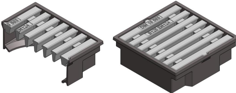
B 125 – Pultform Panel form

ZÜRN GmbH & Co. KG Thierschstraße 11 D-80538 München www.zuern.com Tel.: +49 (0) 89 / 21 23 96-0 Fax: +49 (0) 89 / 29 49 60 info@zuern.com