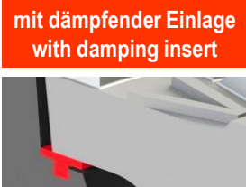
mit dämpfender Einlage with damping insert